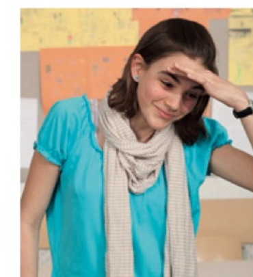
je cherche ...