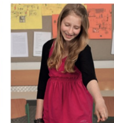
je trouve ...