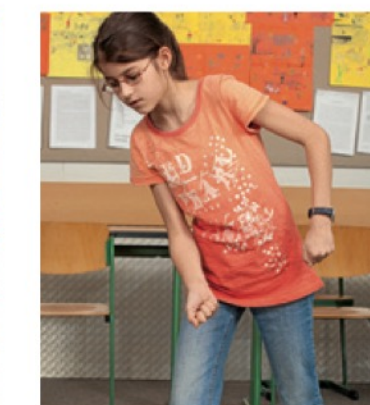
je travaille ...