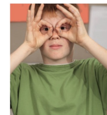
je regarde ...

Ecoutez et mimez les verbes que vous entendez. (Hört zu und macht Pantomimen zu den Verben, die ihr hört.)